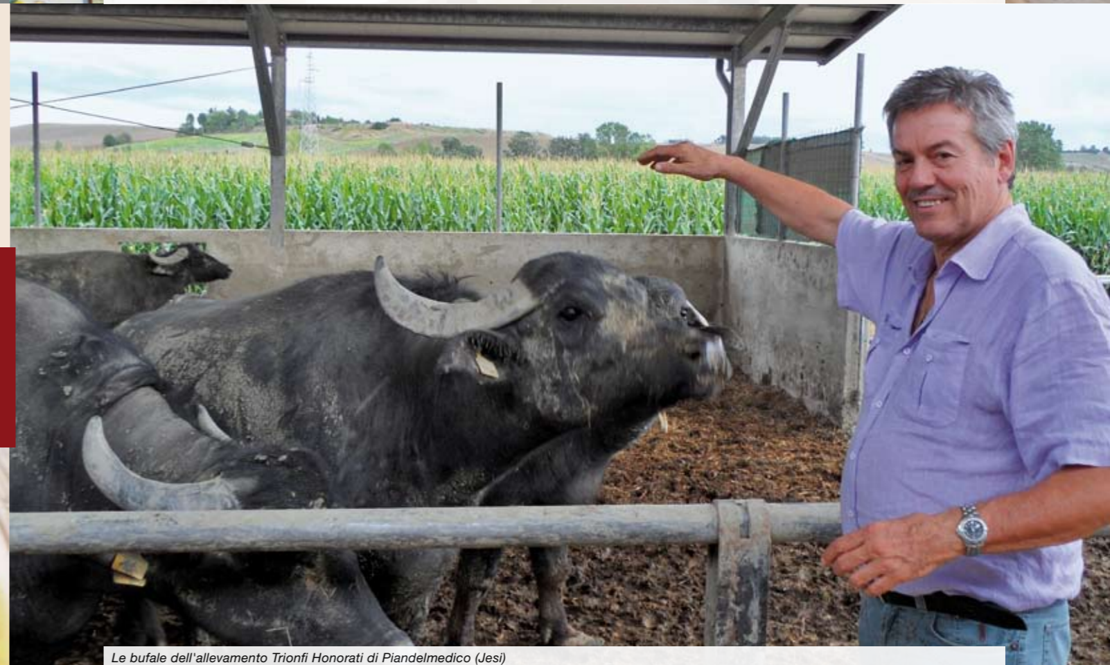
Le bufale dell'allevamento Trionfi Honorati di Piandelmedico (Jesi)