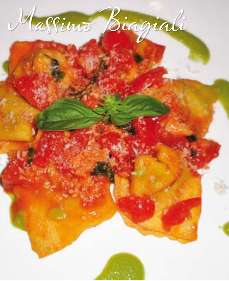
Ravioli con crema di piselli e ricotta in salsa al pomodoro fresco e basilico

Via Enrico Mattei, 4 - 61047 San Lorenzo in Campo (PU) Tel. 0721 776803/776432 - Fax 0721 735323 info@hotelgiardino.it - www.hotelgiardino.it Chiusura: domenica sera e lunedì