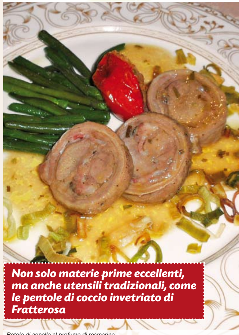
Rotolo di agnello al profumo di rosmarino

Non solo materie prime eccellenti, ma anche utensili tradizionali, come le pentole di coccio invetriato di Fratterosa