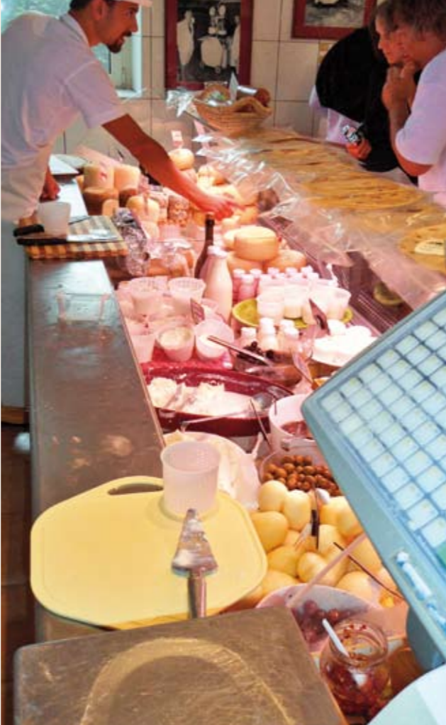
Il negozio dell'azienda Trionfi Honorati